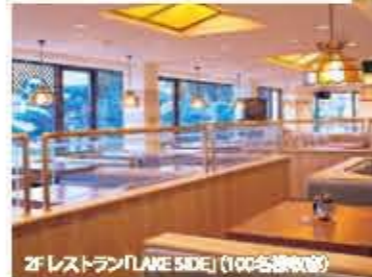
2Fレストラン(LAKE SIDE)(100名様収容)