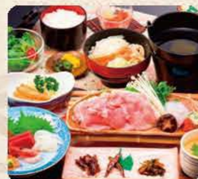
1,200円~2,000円(税別) ※定額1,200円(税別)の料理となります。