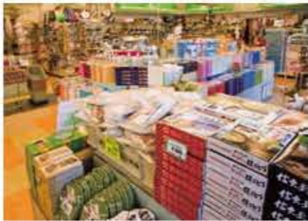
1Fショッピングセンター