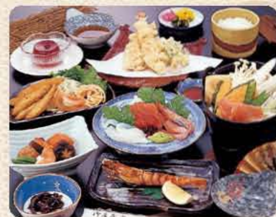
名物 ほうとう鍋御膳 A 3,000円(税別)