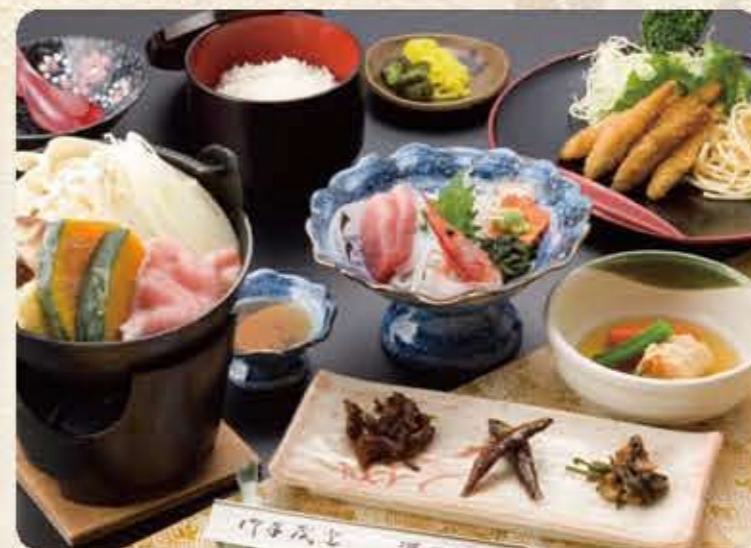
名物 ほうとう鍋御膳 C 1,500円(税別)