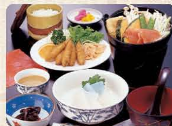
名物 ほうとう鍋御膳 D 1,000円(税別)