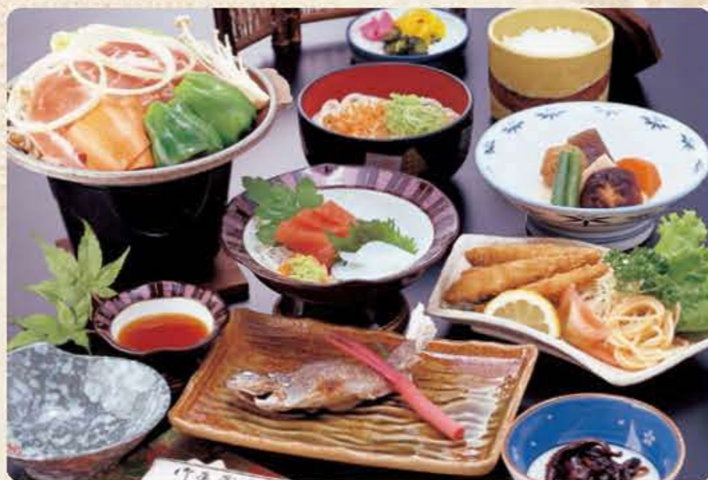
陶板焼御膳 B 2,000円(税別)