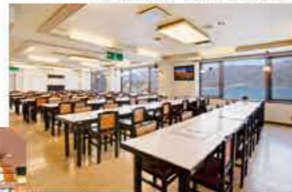
3Fレストラン(テーブル席180名様収容)