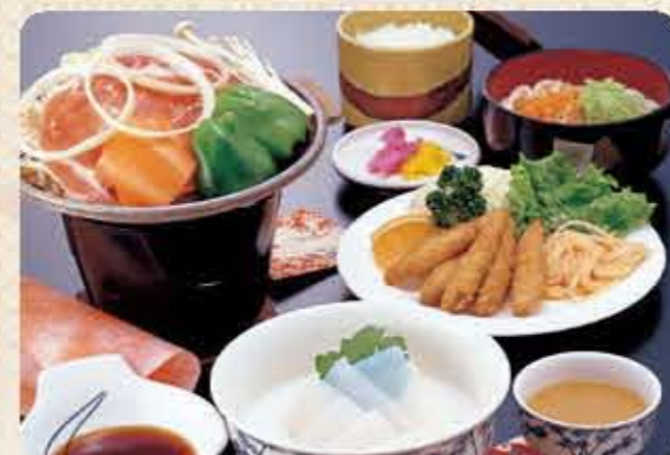
陶板焼御膳 D 1,000円(税別)