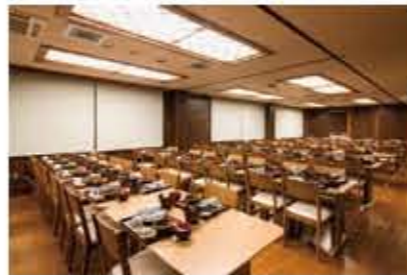
4Fレストラン(テーブル席140名様収容)