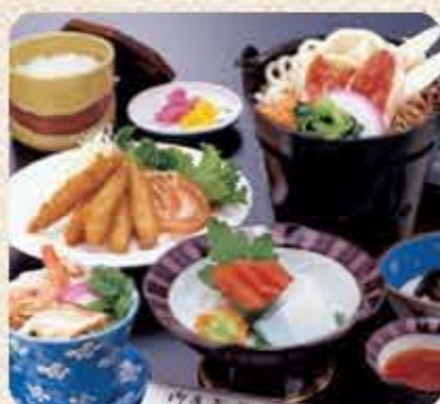
※季節限定となります。 2,000円(税別)