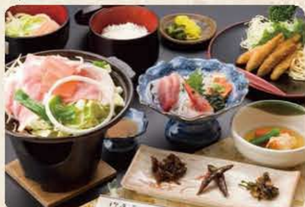
陶板焼御膳 C 1,500円(税別)